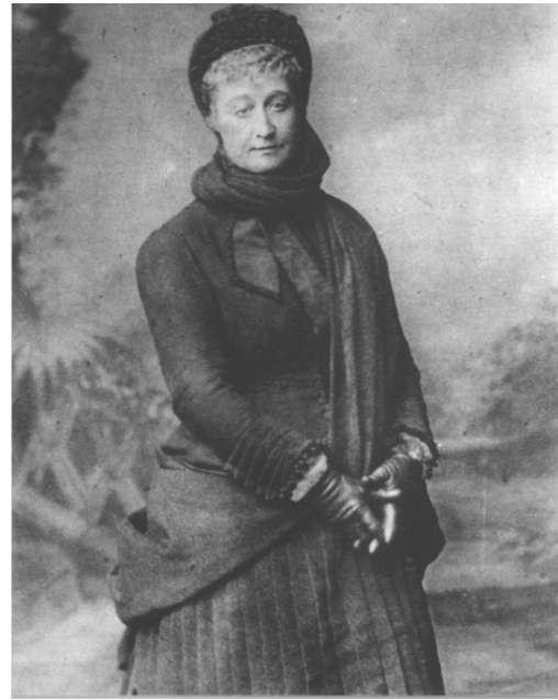
L'Impératrice Eugénie (1826 – 1920)

Le mur de commémoration du Prince Impérial, érigé en 2006, est un don du Lycée Professionnel Julien de Rontaunay, Ste Clothilde, Île de la Réunion.