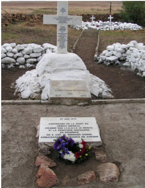
La stèle du Prince Impérial