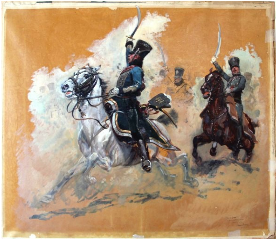
Edouard Detaille, Charge de Hussards.

Nous ne pouvons que vous recommander un petit détour par Tarbes, ville au passé militaire prestigieux et qui abrite encore le 1 er régiment de hussards parachutistes dont la devise « Si tu as tout perdu, souviens-toi, qu'il reste l'honneur », leur vient du hongrois Ladislav de Bercheny.