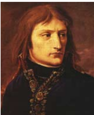
da Bacler d'Albe, castello Malmaison

B onaparte aveva solo 26 anni quando prese il comando dell'armata d'Italia che, partita da Nizza il 2 aprile, in una inesorabile avanzata lungo la costa avrebbe portato alla folgorante scia di battaglie e vittorie che portarono all'Armistizio di Cherasco del 28 aprile 1796 e al celebre proclama: "Popoli d'Italia, l'esercito Francese viene a rompere le vostre catene...".